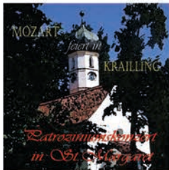
Mozart: 3 Divertimenti, Flötenquartett D-Dur