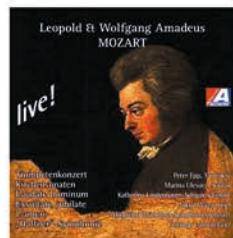
Mozart: Trompetenkonzert, Kirchensonaten, Haffner-Symphonie u.a.