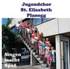
„Singen macht Spaß“

Die Tonträger können bestellt werden unter info@musica-sacra-planegg.de .