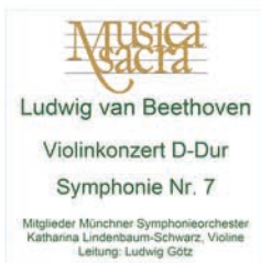
Beethoven: Violinkonzert D-Dur & Symphonie Nr. 7

Marina Ulewicz, Martin Danes, Musica-Sacra-Chor, Mitglieder Münchner Symphonieorchester, Leitung: Ludwig Götz (live 2007, DDD)