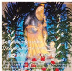
Mendelssohn: Violinkonzert, 2. Symphonie „Lobgesang“

Marina Ulewicz, Barbara Zacherl, Wolfgang Bünten, Tareq Namsi, Musica-Sacra-Chor, Mitglieder Münchner Symphonieorchester Leitung: Ludwig Götz (live 2009, DDD)